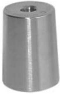
Implantathylsa (02.8903 - 02.8912)