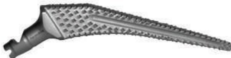
Rasp/Provstam 5,0; 7,5; 10,0; 11,25; 12,25; 13,75 och 15 mm. (08.5147 – 08.5153)