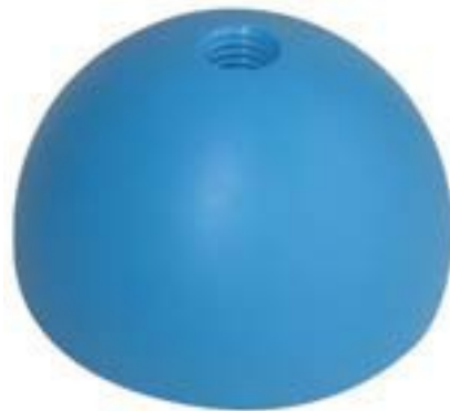
Provhuvud Ø 42 – 58 mm (08.0577 – 08.0585)