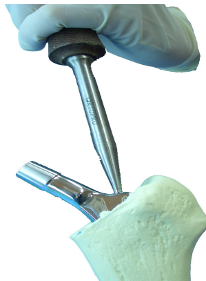
Införandet av stammen med Staminförare med oval tapp (08.0565)