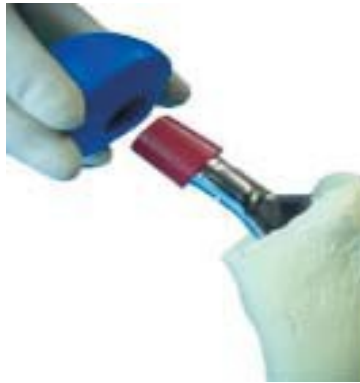
Utprovning av halslängd med Provhuvud och Provhylsa. På bilden visas provhylsa Röd + 4 mm