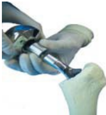
Sammansättning av Huvud och Hylsa och Stam