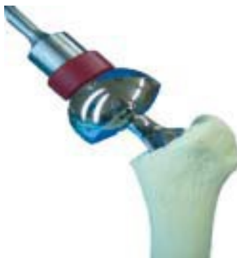
Påslagning av Hemihuvud