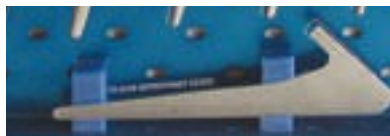
Sågguide till collum 45° (08.5129)