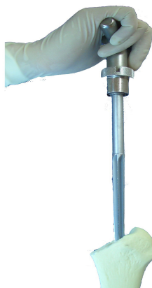
Öppnande av märkekanalen med exmpelvis Osteotom, Boxmejsel eller Reamer