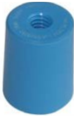
Exempel: Provhylsa blå +8 mm (08.0526)